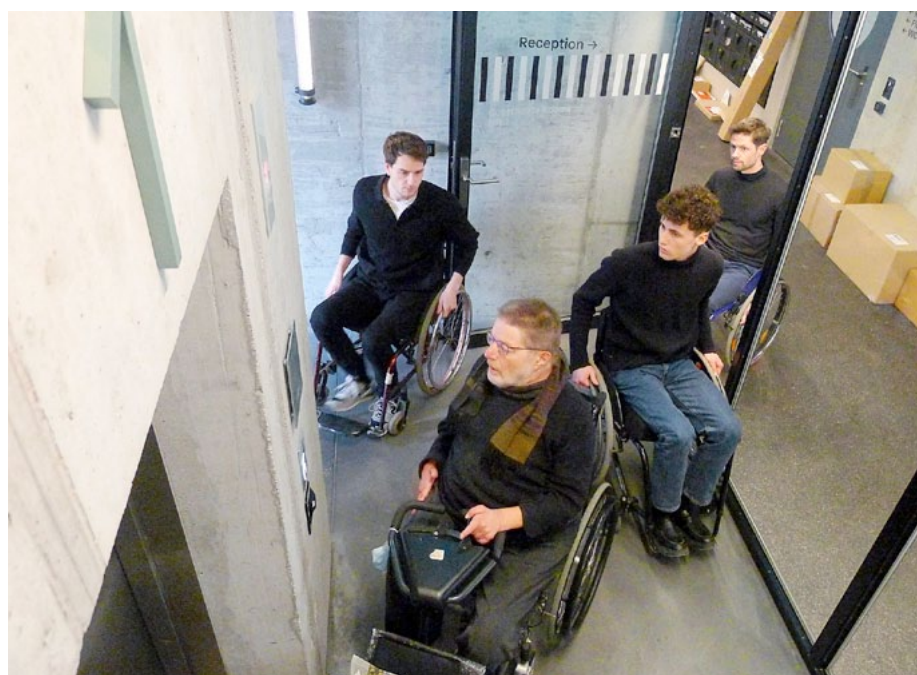
Aha-Erlebnis: Besichtigung des Zollhauses aus der Perspektive des Rollstuhlfahrers.

Im vergangenen Dezember veranstaltete die Fachstelle ein Symposium zur Frage, wie das «Design for all» derzeit in der Architekturlehre verankert ist und wie angehende Architekt*innen für das Thema sensibilisiert werden können.